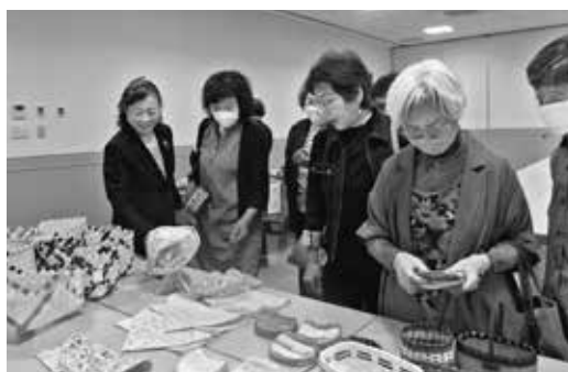
手芸を手にする部員ら