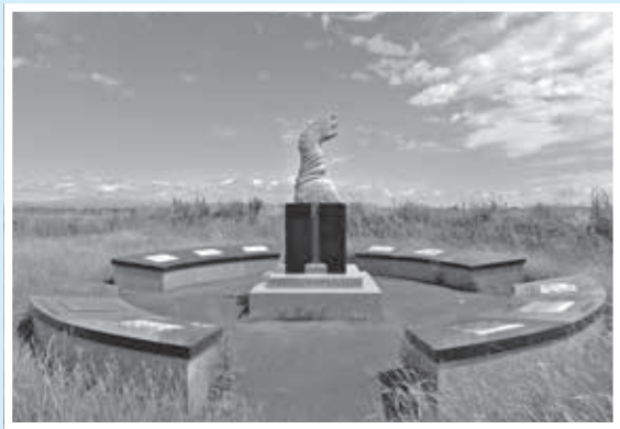
カスリーン公園のモニュメント

昭和22年9月、台風9号(国際名・カスリーン台風)が襲い、関東地方は記録的な豪雨となりました。利根川の堤防は決壊し濁流が東京まで流れ込んだそうです。それによって多数の死者を発生させるなど甚大な被害を引き起こしました。公園として整備し、このような大災害が二度と起こらないように、忘れないようにとカスリーン台風の碑を設置されました。モニュメントは台風が日本列島を襲った経路と台風の渦巻きを表したものです。