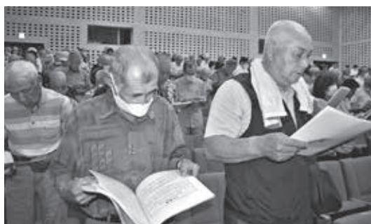
J A 綱領を唱和する総代