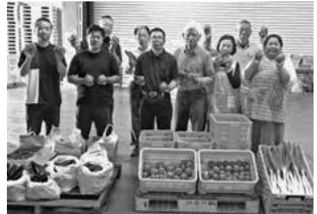
野菜を寄贈する下山会長（前列左から3番目） と同協議会員、フードパントリーの皆さん

今回の野菜は、フードパントリーを通し支援を必要とする200世帯へ、また子ども食堂に100食分の食材として配布されました。