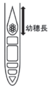
図1 幼穂の模式図 (カッターの切断面)