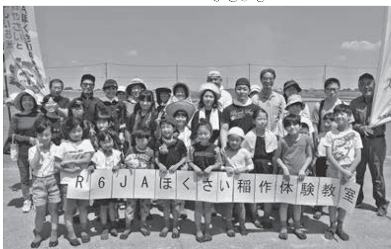
稲作体験教室の参加者