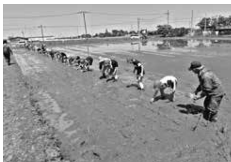
田植えをする三俣小学校の児童ら

5月10日に加須市立三俣小学校5年生3クラス90人は、同市三俣のほ場(みどりの学校ファーム)で学校応援団の深沼集落営農組合指導のもと田植え