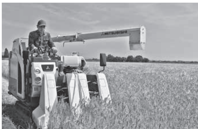
「彩の星」を刈り取る大屋さん

いるので、適宜に赤かび病を防除できたこともあり、品質の良いビール麦になった。自信をもって出荷できる」と胸を張ります。