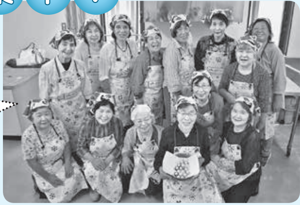
JA女性部羽生支部の皆さん