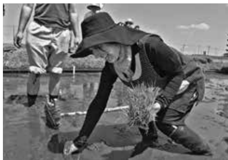
「ほしじるし」を手植える深谷職員

JAは農業を体験し、職員のスキルアップと生産者や組合員と農業について語る職員の育成を目指して、今年度採用の職員に職員研修を行いました。