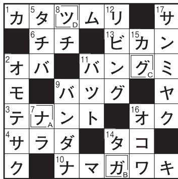
〈6月号の答〉 ナガグツ

・応募の方法 ハガキに答え、住所、氏名、年令、電話番号を記入のうえ、〒348-8513 JAほくさい営業支援課宛送付(住所の記入は不要です)、または各支店・営業経済センター窓口へお持ちください。ご応募はJAほくさい管内(行田市・鴻巣市川里地区・羽生市・加須市)にお住まいの方に限らせていただきます。 ・応募の際、ご意見、本誌へのご感想などをお書き添えください。中から「ほくさい」に掲載させていただくこともあります。 ・締切は令和6年7月末日到着分まで。 ・正解者には抽選により賞品をお贈りします。 ・(個人情報)の取り扱い…この応募用紙は抽選と商品発送およびご意見掲載の目的以外には使用いたしません