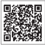
国税庁LINE公式アカウント

会 場 行田税務署 1階事務室 期 間 令和6年2月16日(金)から3月15日(金)まで 土、日及び祝日を除きます。ただし、2月25日の日曜日は、熊谷税務署（熊谷市仲町41番地）で申告相談を行います。この日は行田税務署での業務を行っておりません。 時 間 相談受付：午前8時30分から午後4時まで 相談開始：午前9時から