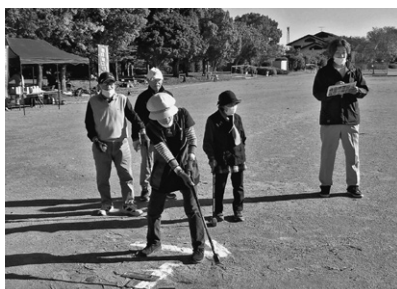
グラウンド・ゴルフをプレーする参加者