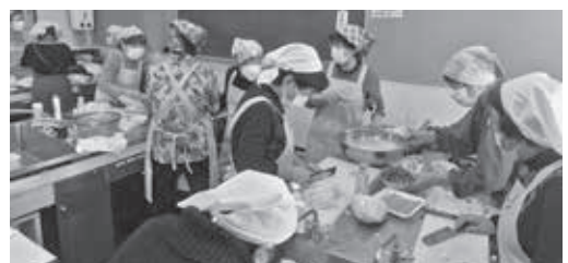
JA女性部南河原支部