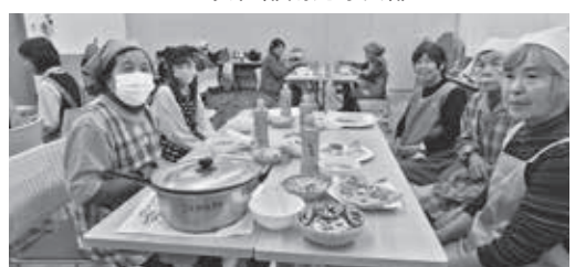
JA女性部西・志多見支部