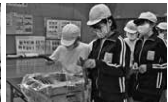
キュウリを詰める児童