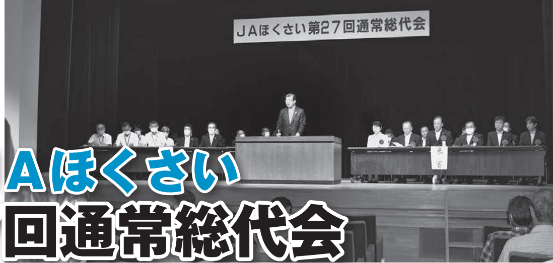
第27回通常総代会 地区別説明会出席状況