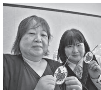
しおりを手にするフレッシュミズ部員