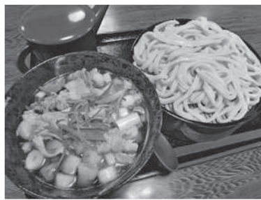
名物の「肉ネギ汁うどん」