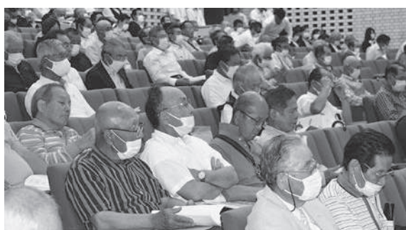
議案を審議する総代