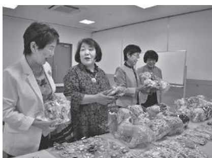
手芸品を手にとる部員