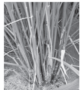
図2 紋枯病の罹患株