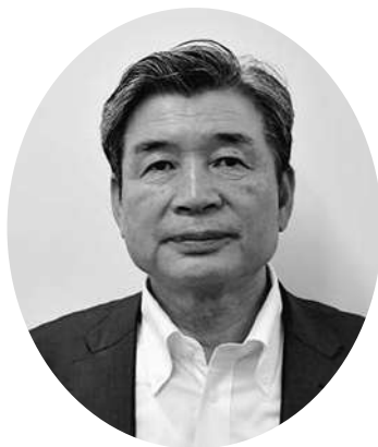
ほくさい農業協同組合 代表理事組合長