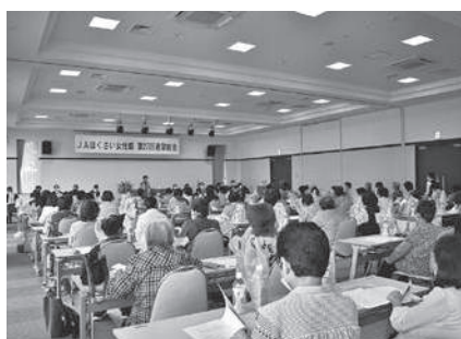
議案を審議する部員