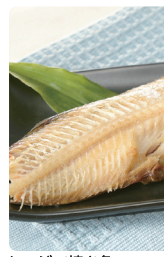
レンジで焼き魚 しまほっけ