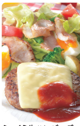
ふっくら生ハンバーグ (和豚もちぶた使用)