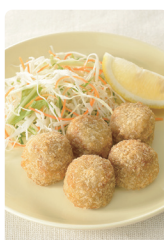
レンチンOK コロケ(ビーフ)