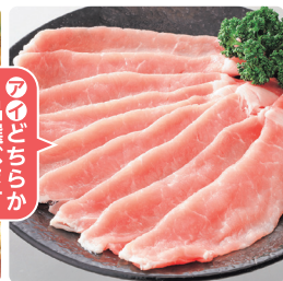
① ローズポークロスライス