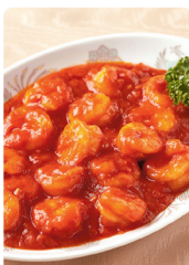
大きなむきえびの チリソース

1回あたり2,052円(税込) ※月11回宅配の場合 ※月10回宅配の場合は1回あたり2,257円(税込)となります。(22,572円(税込)/月)