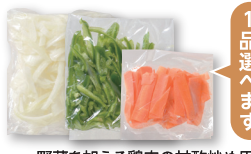
② 野菜を加える鶏肉の甘酢炒め用 カット野菜