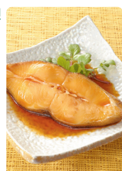
湯煎で簡単！ からすがれいの煮付け

1回あたり1,080円(税込) ※月11回宅配の場合 ※月10回宅配の場合は1回あたり1,188円(税込)となります。(11,880円(税込)/月)