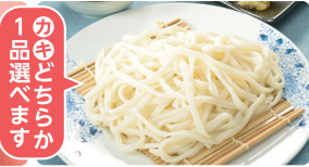
④ 甲州地粉手もみ式うどん