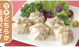
④ あじわいポーク焼売