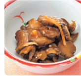
パリパリきゅうり