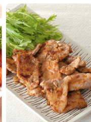
ローズポークモモ肉 (梨果汁入り)