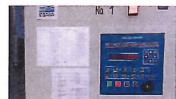
環境制御盤の導入