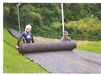
茶の被覆作業の実施