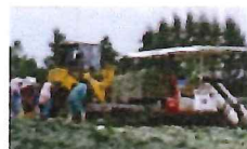
機械化体系の導入