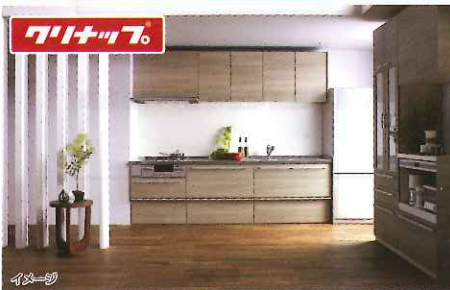
システムキッチン ラクエラ 2550タイプ