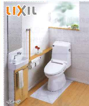
トイレ アメージュトイレ 0.5坪