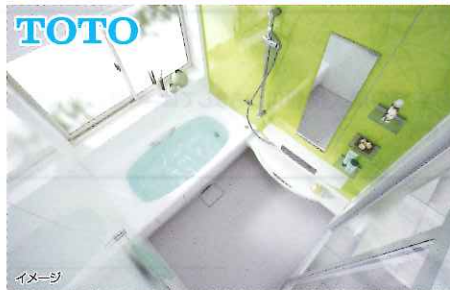
システムバス サザナSタイプ 0.75坪 洗面所(1坪) 床・壁・天井クロス張り替え