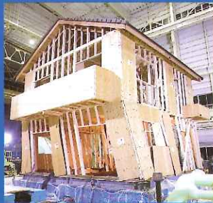
耐震補強がされていない建物での実験後の写真